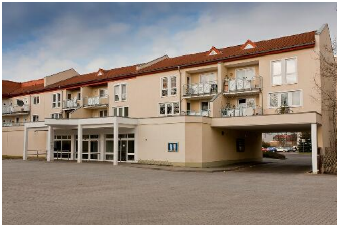
Eingangsbereich u. Parkplatz

Mietbjekt: Forst, Am Haag - SB-Markt Exposé für das Objekt: Forst-G-0.1