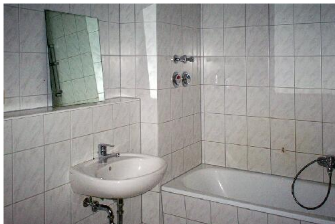
Bad / WC