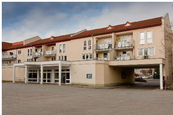
Ansicht des Gebäudes (Innenhof)

Mietbjekt: Forst, Am Haag Exposé für das Objekt: Forst-W-2.02